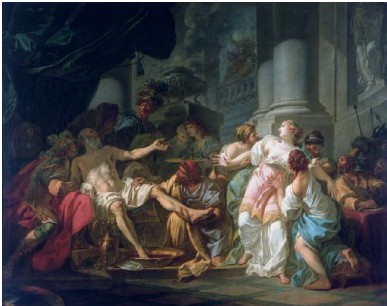
Morte di Seneca, di Jacques Louis David

https://upload.wikimedia.org/wikipedia/commons/5/5c/David_La_morte_di_Seneca.jpg Jacques-Louis David [Public domain], via Wikimedia Commons