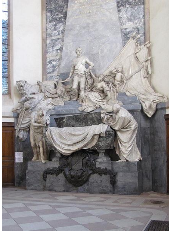
Mausoleo di Maurice de Saxe (Strasburgo, San Tommaso)