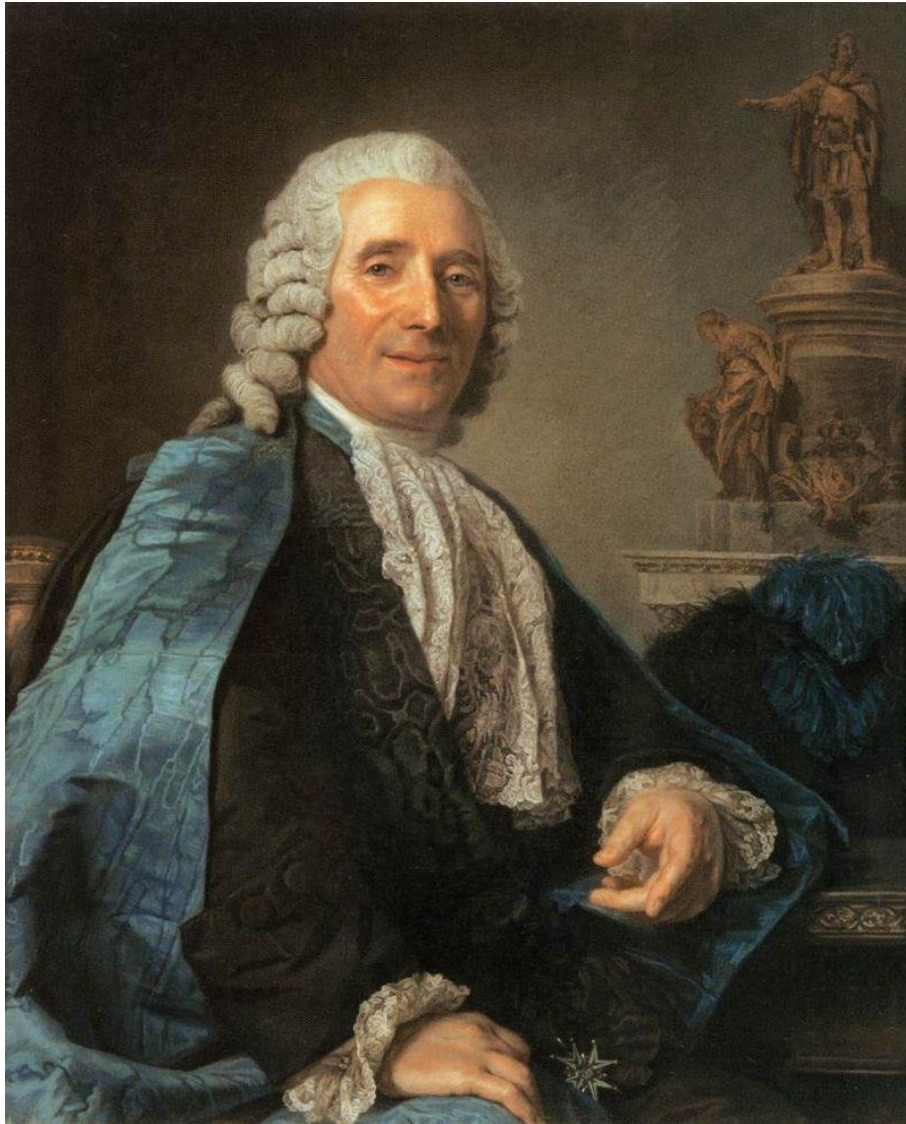
Ritratto del protagonista, di Marie-Suzanne Roslin