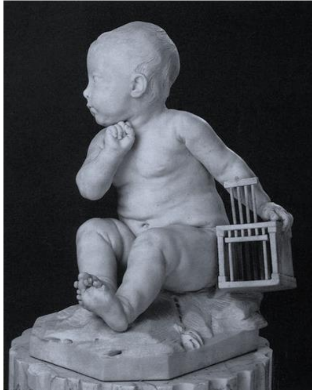
Bambino con la gabbia