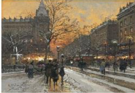
E. Galien-Laloue, Place Pigalle