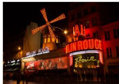
Moulin Rouge, che però è sul Boulevard de Clichy