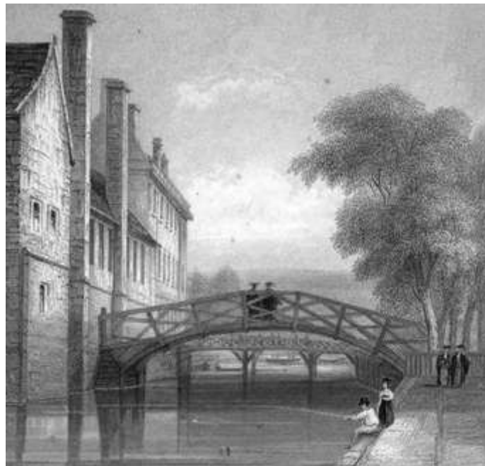
Il “ponte matematico” a Queen’s College (Cambridge)