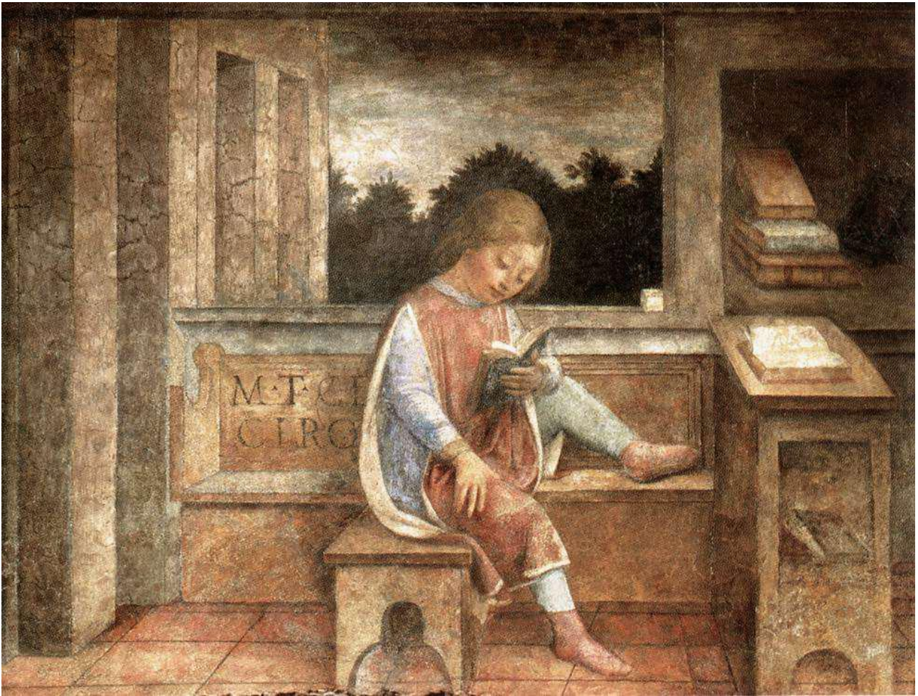
Vincenzo Foppa ( 1427-1515) : Marco Tullio Cicerone bambino in lettura.

Il programma in Small Basic che presento qui, ha l'ambizione di facilitare il ripasso della sintassi del periodo latino. Il metodo è semplice: sono stati scelti 414 esempi da una grammatica latina d'altri tempi, e lo studente si esercita tradurre la frase dal latino ed a riconoscere le costruzioni. Poiché la traduzione in Latino non è più materia di esame, in questo ripasso mi limito alla traduzione dal latino (ma lo studente vedrà che, esercitandosi spesso, imparerà anche la traduzione in direzione opposta).